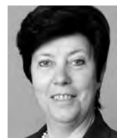
Hedy Imboden Primarschule