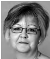
Evi Jossen Primarschule