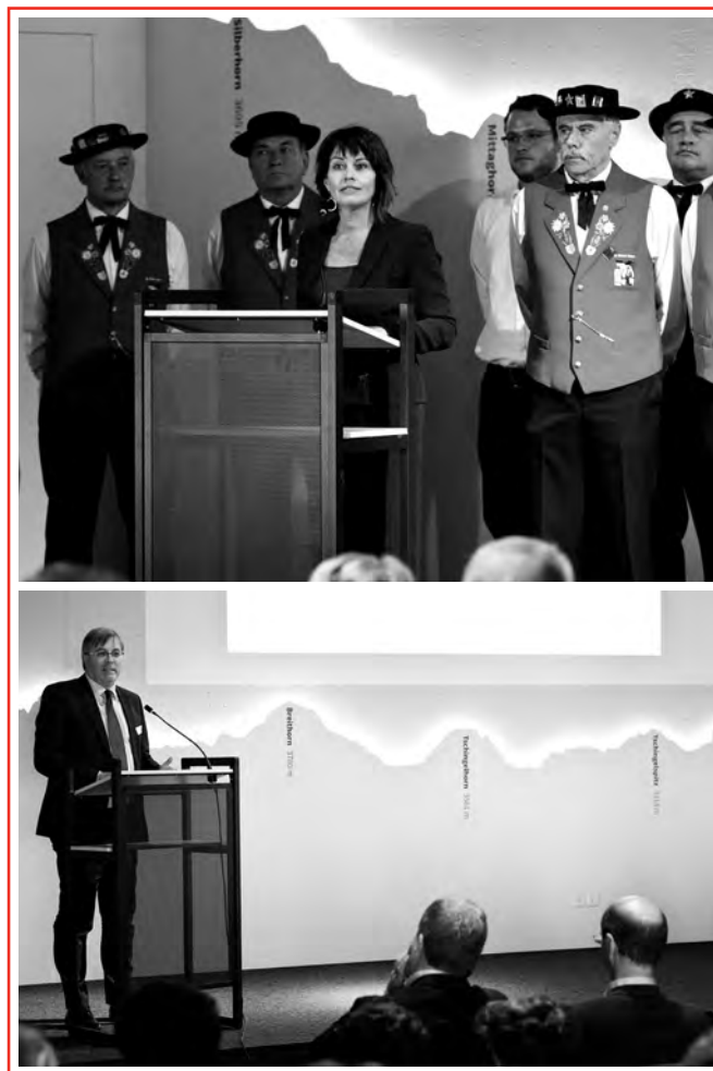
Hochkarätige Redner eröffneten das World Nature Forum in Naters: unter anderem Bundesrätin Doris Leuthard und Staatsrat Jean-Michel Cina.

Mit spannenden Filmen, interaktiven Erlebnisstationen, Info-Grafiken und Artefakten wird in der spektakulären Ausstellung auf Fragestellungen im Umgang mit diesem Erbe verwiesen. Ein Highlight ist der grosse Panoramaraum, in dem auf einer 100 m 2 grossen Leinwand nie gesehene Filmszenarien aus dem UNESCO-Welterbe die Besucher begeistern werden. Die Ausstellung ist so ausgerichtet, dass sie sowohl für Kinder wie Erwachsene, für Spezialisten wie Laien neue Einblicke in dieses Gebiet bietet, aber vor allem Spass und Unterhaltung gewährleistet.