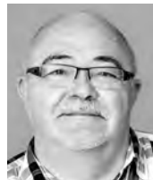
Norbert Zurwerra Orientierungsschule