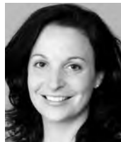
Adrienne Michlig Primarschule