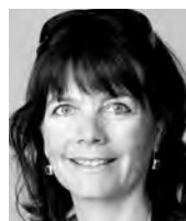
Liliane Eyer Primarschule