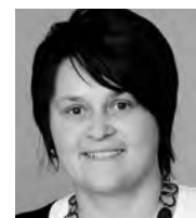
Sandra Zeiter Primarschule