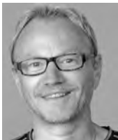
Marcel Jossen Primarschule