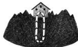
System: WÄRMEPUMPE MIT ERDSONDE