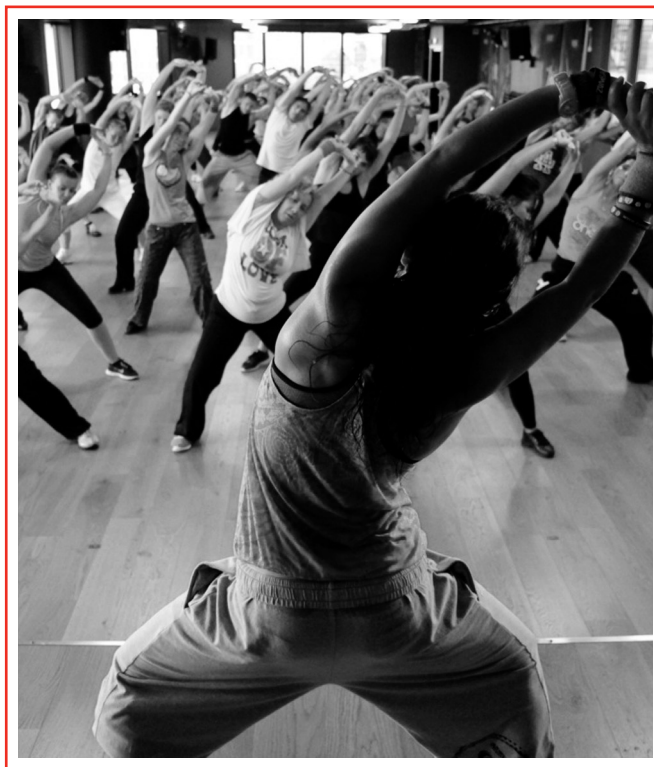
Der Tanz- und Fitnessstrend Zumba wird ab 2013/14 neu im Kursprogramm der Erwachsenenbildung angeboten.