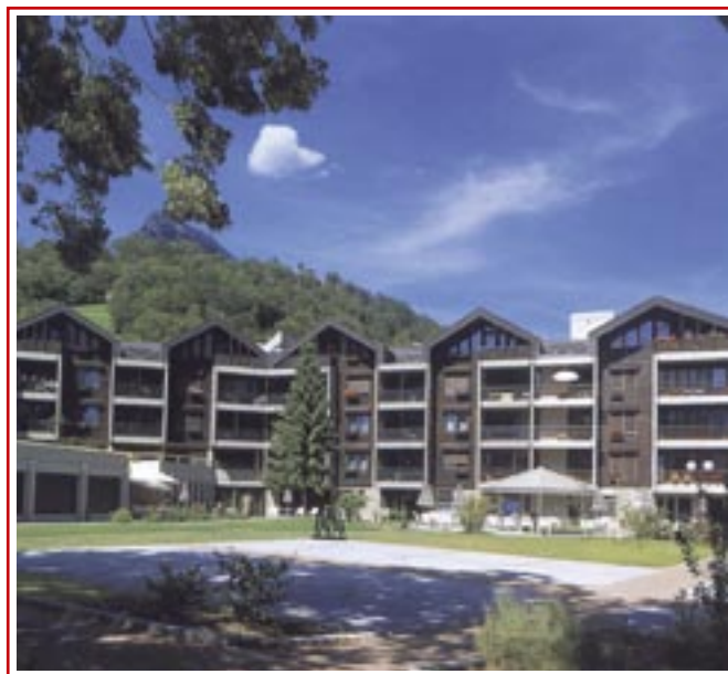
Alterssiedlung Sancta Maria

Kennzeichnend für das Alters- und Pflegeheim St. Michael ist der sogenannte Betrieb der Mischform. In dieser können sowohl Personen mit Altersheimansprüchen wohnen, als auch solche die einen hohen Pflegebedarf aufweisen. Die Mischform hat zwei grosse Vorteile: Erstens entfällt für Bewohner, die im Altersheim wohnen, beim Auftreten von erhöhtem Pflegebedarf ein belastender Umzug im letzten Lebensabschnitt. Mit diesem Konzept, das