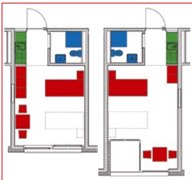
Grundriss der Zimmertypen (links ohne Balkon und rechts mit Balkon)

sich in der Alterssiedlung Sancta Maria in den letzten 25 Jahren bewährt hat, wird der Selbstständigkeit, der Unabhängigkeit und der Geborgenheit älterer Mitmenschen Rechnung getragen. So viel Hilfe wie notwendig, so viel Selbstständigkeit und Freiheit wie möglich! Zweitens schlägt sich die Mischform auch deutlich in der Kostenstruktur des Heimes nieder. Dies ist der Grund, dass in Naters für die Bewohner deutlich niedrigere Preise anfallen. Der Preis pro Einzelzimmer und pro Tag beträgt zwischen 62 und 75 Franken inklusive Verpflegung.