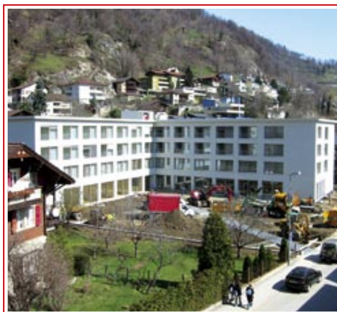
Alters- und Pflegeheim St. Michael